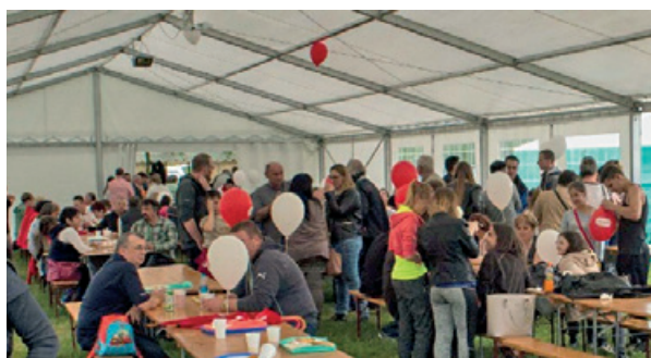
Pálinka fesztivál 2016.