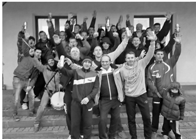
A csapat és a szurkolók

Felnőtt csapatunk az őszi szezont veretlenül, a tabella élén zárta. Bízunk a tavaszi hasonlóan jó szereplésben. Köszönjük a szurkolók lelkes támogatását.