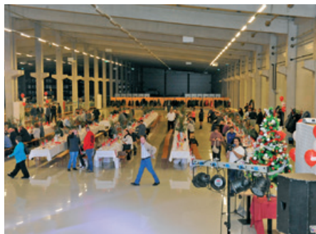
Évzáró vacsora a FERZOL-nál 2015.)