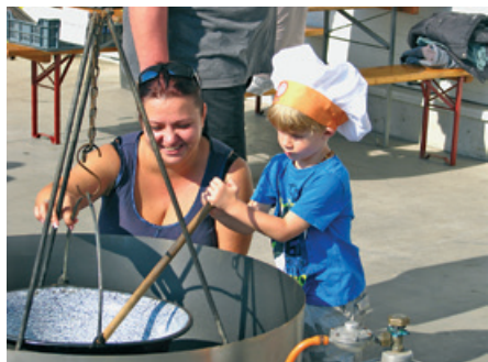
Családi nap 2016.