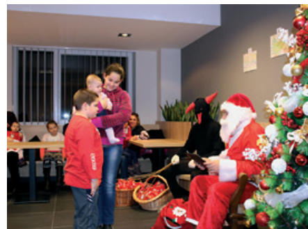
Mikulás érkezik a FERZOL – hoz