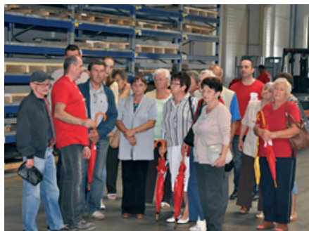
Nyílt nap a Ferzol Kft-nél