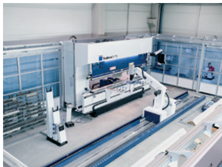
Hajlító Robot Cella