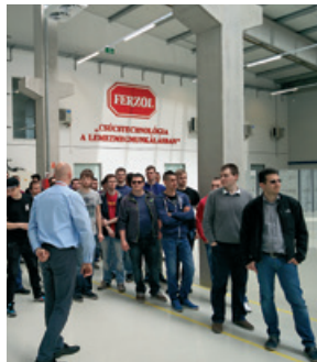
Duális képzés indítása