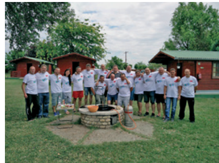
Csapatépítő tréning a vezetőknek 2016.