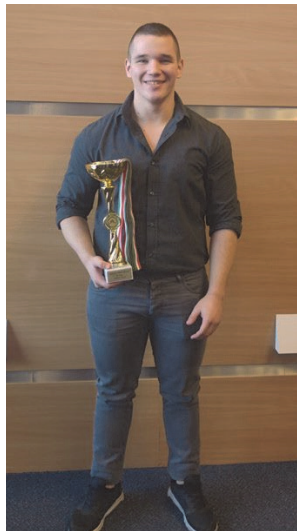
MSSZ Kupa átadóján

Az idei év sem indul kevésbé eseménydúsán a Tápiószőlősi fiatal számára. Az előző évben elért sikereinek köszönhetően a Kecskeméti Éves Díjátadó Ünnepeken öt és csapatát az egész éves kiemelkedő munkájáért díjazták. A Magyar