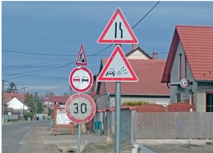
Folytatódik a csatornahálózat kiépítése

Itt a tavasz, jönnek a legszebb hónapok: március, április, május és aztán itt a nyár. Sorban jönnek majd az események községünkben is. Megrendezésre került a Sportbál, majd közeleg a március 15-ei ünnepség. Hamarosan következik az Európai Parlamenti választás, Húsvét, ezzel együtt a tojásfa állítás, majd községünk csinosítása a Föld napja alkalmából.