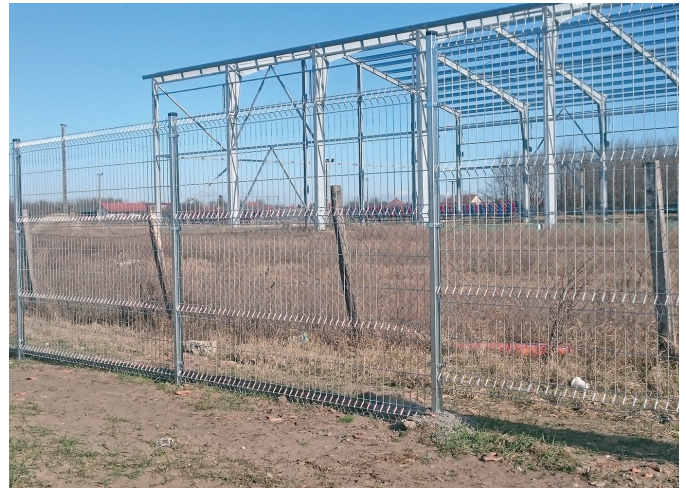
Befejeződött a Sportpálya kerítésének építése

jóvoltából a tápiószőlősi lakosságnak csak töredékébe kerül a csatornázás a faluban. Itt szeretném felhívni a Lakosság figyelmét arra, hogy településünkön szigorú sebességkorlátozás van érvényben az építkezés miatt! Nem véletlen a 30km/órás korlátozás, hiszen a nagy sebesség miatt felcsapódó kavicsok súlyos sérülést okozhatnak gyalogosnak, kerékpáros-