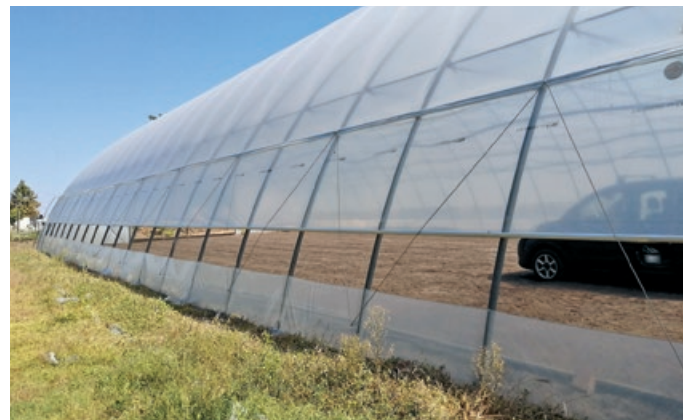
Az oldalszellőzővel ellátott fólia