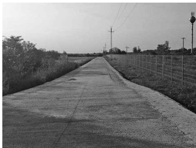
Szennyvíztelephez vezető új út

aszfalt felület! Előzzük meg az esetleges baleseteket! Az iskolai fejlesztéseket a gyerekek nagy örömmel használják, úgy gondolom, jó kezekben van az óvodánk, iskolánk. A bölcsőde pályázat elbírálása még tart, reményeink szerint 2021-ben megépül. A védőnői-fogorvosi épület szigetelése és tető felújítása várhatóan, csak tavasszal kezdődik meg.