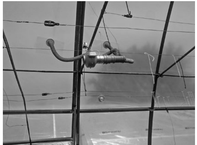
Felfújó motor a fóliában

villanyoszlopok új betonoszlopokra lettek cserélve. Ki lett javítva az Alkotmány út a csatornázás okozta hibák után.