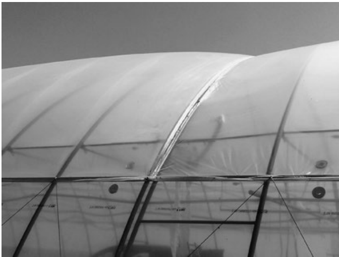
A duplafalú felfújó fóliasátor