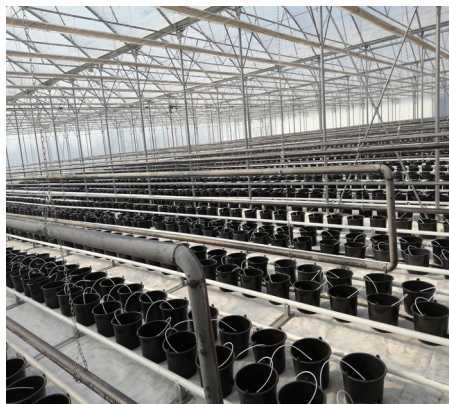
Az új fóliaház majdnem készen