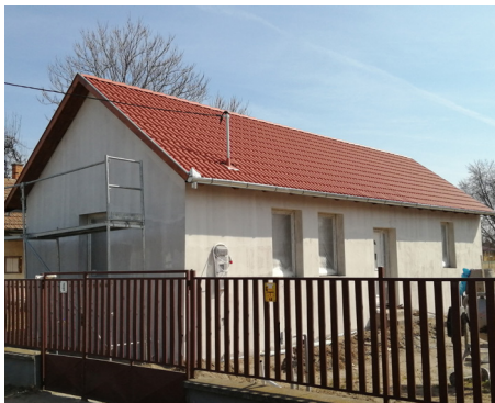
Politechnika épületéből új lakás

még szakemberekre, anyagi segítségre vár. Március második felében folytatódik a Bicskei úton a kerékpár sáv másik oldalának kialakítása. Emiatt felhívjuk a lakosok figyelmét, hogy a parkolásnál és a beállításoknál legyenek figyelemmel a munkálatokra! Örömmel mondhatom el, hogy sikerült egy nagy álmunkat megvalósítani. Pályázatot nyertünk Tájház/Falumúzeum létrehozására. A minden szempontnak megfelelő épület a Boglárka úton, a volt Némedi ház lett, amelyben minden, ami a régmúltunkra emlékeztet megtalálható. Ennek a pályázatnak köszönhetően első lépésként elkészült a leendő tájházhoz az út a Bata és a Boglárka út között. Hamarosan állagmegóvás miatt munkálatok kezdődnek ott az épületen. A politechnika épületéből kialakított szolgálati lakás várhatóan két hónapon belül költözhető lesz. Elkészült a piac a Polgármesteri Hivatal hátsó udvarában. Elkészült a Polgármesteri Hivatal előtti parkoló és március 19-én 10.00 órakor országgyűlési képviselőnk, Czerván György lerakta a leendő Bölcsőde alapkövét az Óvoda hátsó udvarában. A tervek szerint két csoportszobás, közel 200 m 2 alapterületű épület lesz. Folytatjuk a járda kialakítását az Árpád út, Deák Ferenc utca és Arany János utak mentén. Kialakításra kerül a temetőnél egy kulturált parkoló, meghosszabbítjuk a református oldalon a viakoloros felületet a kerítésig, a katolikus oldalon pedig új járda lesz kialakítva. Folyamatban van a Magyar Falu program