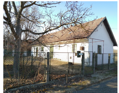
A Némedi féle ház, melyből Tájház lesz