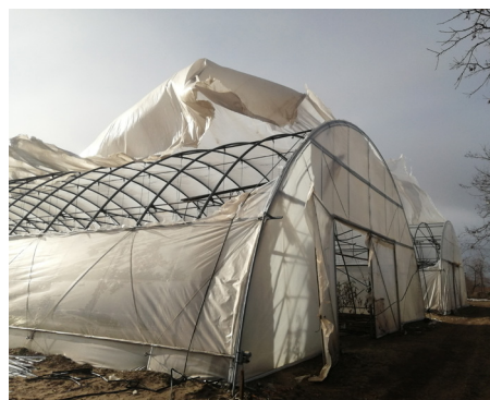
Fóliatelep a szélkár után