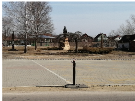
Új parkoló a PM. Hivatal előtt, járda a játszótérhez