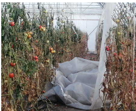
A tönkrement paradicsom a szélkár után