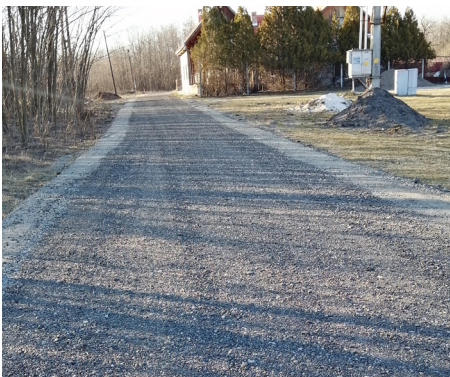
Bataút-Boglárka út összekötése a Tájházhhoz