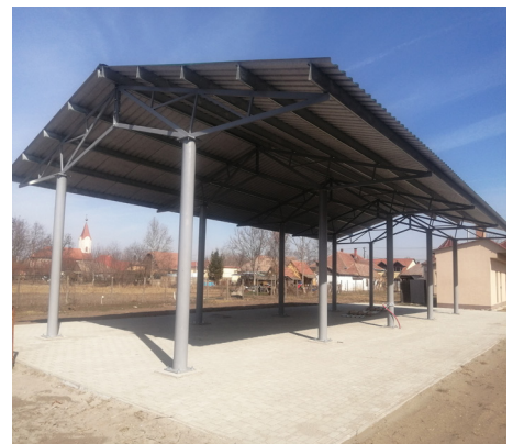
Az új piac

keretében elnyert dupla kabinos, billenős kisteherautó beszerzése, mely remélhetőleg sokat fog segíteni a Hivatali dolgozók munkájában. A fólia beruházás átadása után a kertészetben meglévő épület felújítása következik. Teljes tetőcsere, valamint elektromos hálózat cseréje lesz. Közben a választások miatt a volt Védőnői szolgálat tetőszerkezetét meg kell javítani, mert beázik, és ezeket a beázásokat, foltokat kell a választásokig megszüntetni. A sertéstelep be van telepítve, a vágóhid termel. A Sportcsarnok kivitelezése is tovább halad, az elektromos szerelések következnek, a kerítés áthelyezése a régi épülettel összekötő nyaktag, falbontás kialakítása van a feladatok között. Az Óvoda udvarán egy most elnyert pályázatnak köszönhetően újabb játékok kerülnek beszerzésre és elhelyezésre. A Polgármesteri Hivatal melletti és előtti tér, a vágóhid, a sertéstelep, a műhely és fóliatelep bekamerázása megtörtént. Remélhetőleg tovább folytatjuk a megfigyelő rendszer bővítését. A kültéri WIFI pályázaton nyert három terület lefedése is hamarosan meg fog történni a Polgármesteri Hivatalnál, a Sporttelepnél és a Központi konyhánál. Kiosztásra kerültek a szelektív kukák. Megkérjük a Lakosság azon részét, akik még nem vették át a kukákat, azok forduljanak az Önkormányzat Alkotmány úti műhelyében dolgozó adminisztrátorainkhoz, mert visszaszállításra kerülnek a ki nem igényelt szelektív kukák és csak Cegléden lehet majd őket beszerezni.