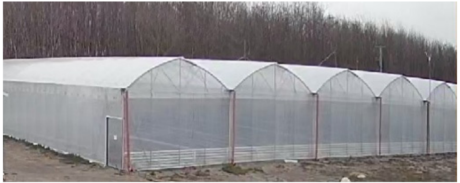
Az új fóliablokk és a feldolgozó épület